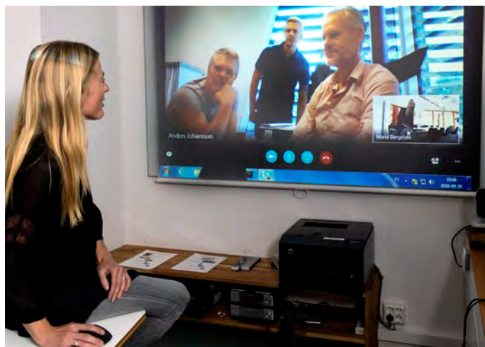
Skype är ett komplement och ett sätt att öka vår tillgänglighet.

Att mötas på distans ställer krav på tydlighet så att alla följer